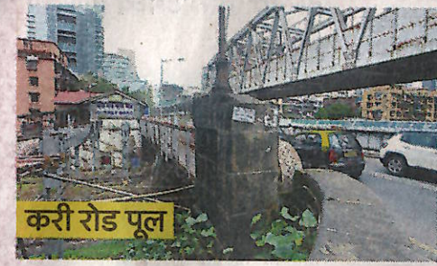
करी रोड पूल

१३० वर्षे जुना असलेला हा मुंबईतील पूल २४ जूनपासून वाहतुकीसाठी पुढील १८ महिन्यांसाठी बंद ठेवण्यात आला आहे. मुंबई सेंट्रल येथील बेलासिस आरओबी (रोड ओव्हर ब्रिज) पूर्वेकडील डॉ. आनंदराव नायर मार्ग ते पश्चिमेला वसंतराव नाईक चौक यांना जोडणारा हा पूल आहे. दक्षिण मुंबईतील ब्रिटिशकालीन पुलांमध्ये बेलासिस पुलाचा समावेश होतो. पुलाची उभारणी १८९३ मध्ये करण्यात आली होती. १३० वर्षे जुन्या असलेल्या या पुलाची लांबी ३८० मीटर आणि रुंदी २२.२० मीटर आहे.